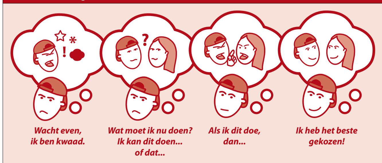
Figuur 6.3 Poster voor leerlingen

Om deze cognitief gebaseerde strategieën te implementeren, kunt u een bespreking beleggen met de leerling en zijn ouders of verzorgers om uit te leggen dat u de leerling wilt helpen aan de hand van een bepaalde methode. Er zal heel wat discussie aan voorafgaan om te bepalen welk gedrag van de leerling prioriteit heeft. Met dergelijke cognitieve methoden is het tevens van belang de manier van denken te gebruiken die in bovengenoemde stappen is aangegeven. Zo kunt u bijvoorbeeld hardop denken, terwijl u de leerling door de procedure coacht. Of u beschrijft een episode in uw leven, waarin u blij geweest zou zijn met een dergelijke methode. Dan neemt u de procedure stap voor stap door en ondertussen beschrijft u wat u denkt. Vervolgens kiest u een situatie uit het verleden van de leerling, waarin hij baat gehad zou hebben bij de methode. In dit geval kunt u de leerling vragen zelf de stappen in gedachten door te nemen en hardop te zeggen wat hij denkt bij elke stap. Samen brainstormt u over alternatieve handelingen die hij had kunnen overwegen, met de consequenties van elk daarvan. Als de leerlingen eenmaal weten hoe deze procedure werkt, kunnen ze het uitproberen in de groep.